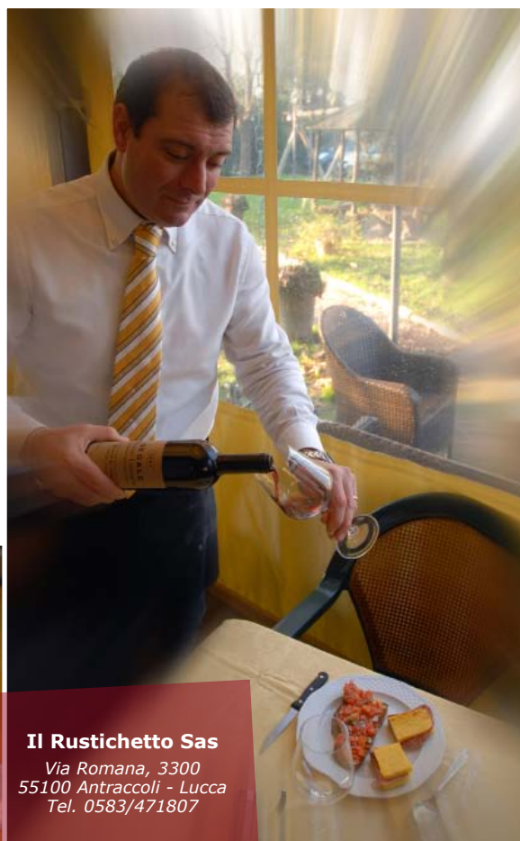
Il Rustichetto Sas Via Romana, 3300 55100 Antraccoli - Lucca Tel. 0583/471807

Non manca la "Corrida dei Paesani allo sbaraglio" con premi e gara di karaoke, concerti jazz, feste anni '60-'70-'80, la festa di Ferragosto, imperdibili happy hours in cui fanno bella mostra di sé ortaggi e frutta sapientemente intagliati e tante altre iniziative.